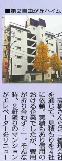
第2自由が丘ハイム