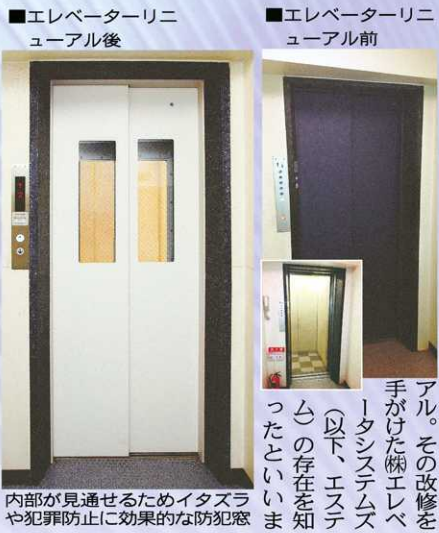
内部が見通せるためメッシュや犯罪防止に効果的な防犯窓